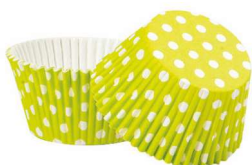
PAPILOTKA POLKA GROSZKI ZIELONE