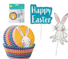
ZESTAW HAPPY EASTER