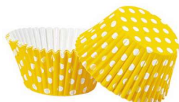
PAPILOTKA POLKA GROSZKI ŻÓŁTE