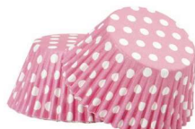
PAPILOTKA POLKA GROSZKI RÓŻOWE