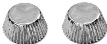
PAPILOTKA SREBRNA MAŁA