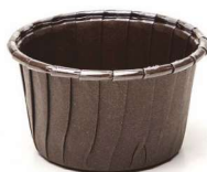
MUFFIN ECOS OPTIMA