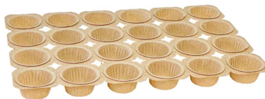
STELAŻ NA MUFFINY COCOA