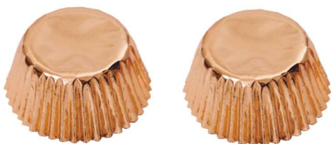
PAPILOTKA RÓŻOWE ŻŁOTO