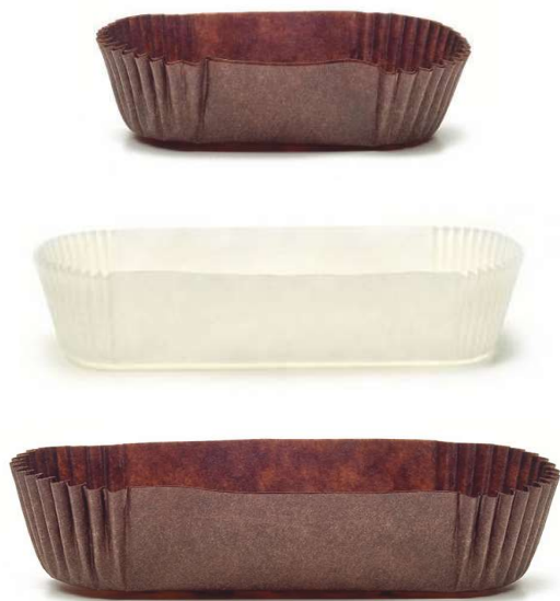
Kolory: beżowy, brązowy