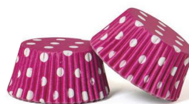
PAPILOTKA GROSZKI FUKSJA