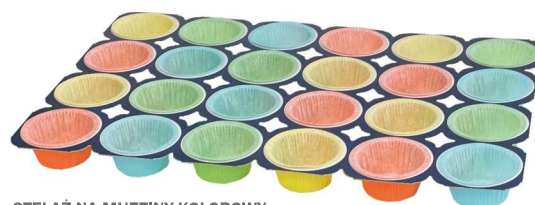
STELAŻ NA MUFFINY KOLOROWY