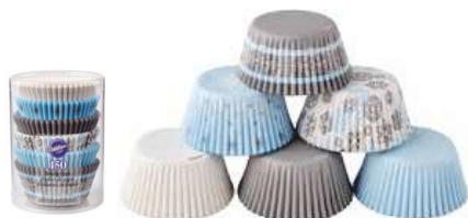
PAPILOTKI BOŻE NARODZENIE