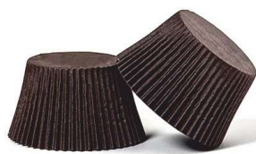
PAPILOTKA POLKA BRĄZOWA