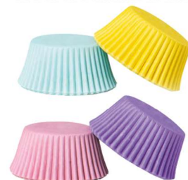
PAPILOTKA PASTEL (mix kolor: fiolet, róż, limonka, turkus)