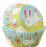
PAPILOTKA KRÓLIK NA ŁĄCE