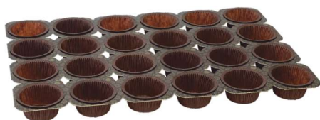
STELAŻ NA MUFFINY BRĄZOWY