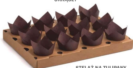
STELAŻ NA TULIPANY