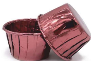
MUFFIN RÓŻOWE ZŁOTO