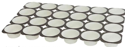
STELAŻ NA MUFFINY BIAŁY