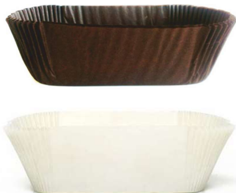
Kolory: beżowy, brązowy