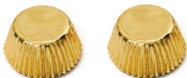
PAPILOTKA ŻŁOTA MAŁA